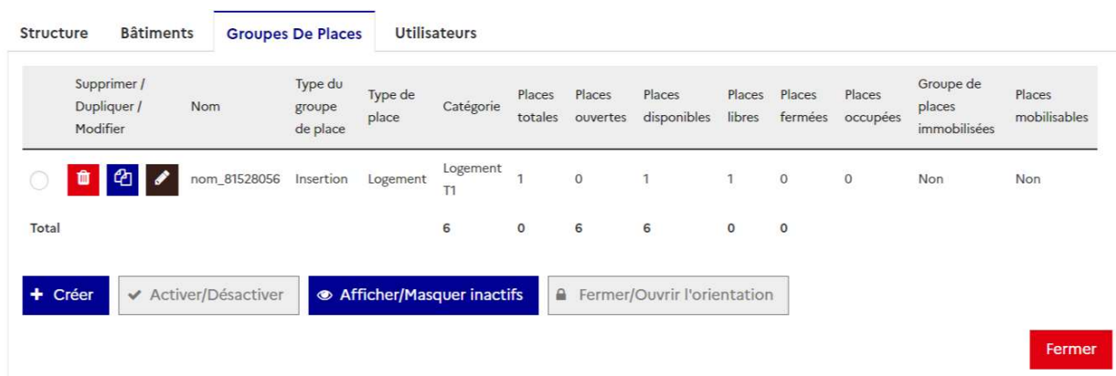
Figure 1 – Capture de la nouvelle organisation des boutons de gestion d'un groupe de places

Pour faciliter la navigation, les boutons modifier/dupliquer et supprimer sont déplacés à gauche de l'écran entre le bouton radio (de sélection) et le nom du groupe de place.