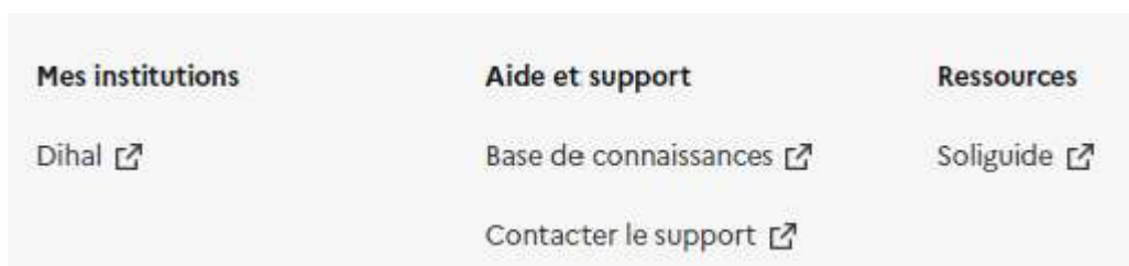
Figure 6 – Bas de page, lien vers Soliguide

Il renvoie vers le site : https://soliguide.fr/fr